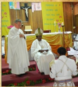
Uroczystości profesji wieczystej