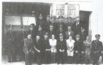
Strazacy białowej w 1993 r.