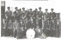
Orkiestra dęta OSP w Białowej, rok 1953.

Za aktywne prace jednostki Ochotniczej Straży Pożarnej w Lecce otrzymała w 1960 r. motopompę „Typ - 800”. Systematycznie powiększano sprzęt do ochrony przeciwpożarowej. W 1966 r. przystą- piono do budowy Dому Strażaka. Po wybudowaniu budynku strażackiego posiadany sprzęt znalazł właściwe zabezpieczenie przez niszczeniem. W budynku tym znalazło się także pomieszcze- nie na prowadzenie życia oświatowo-kulturalnego.