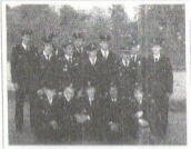
Senty z Mokosza