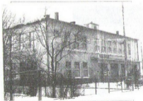
Dom Strażka w Białoszej